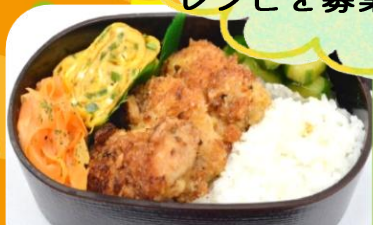
第26回料理部門グランプリ