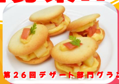
第26回デザート部門グランプリ